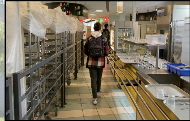
File d'attente spécifique à la borne PLAT DU JOUR